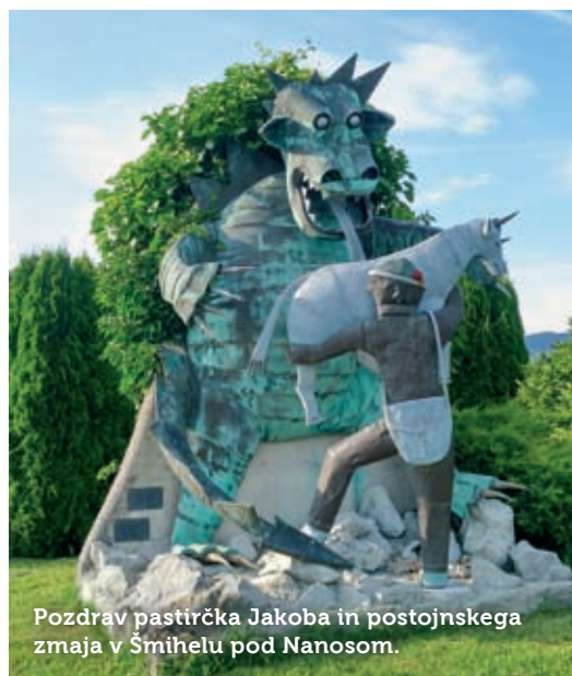
Pozdrav pastirčka Jakoba in postojnskega zmaja v Šmihelu pod Nanosom.

V središču Landola zavijemo proti Šmihelu. Peljemo se mimo prenočišča Lipizzaner Lodge . Valižan in Finka sta se le po enem izletu skozi naše kraje zaljubila v to deželo in na koncu ureničila svoje sanje o odprtju lastnega hotelčka.