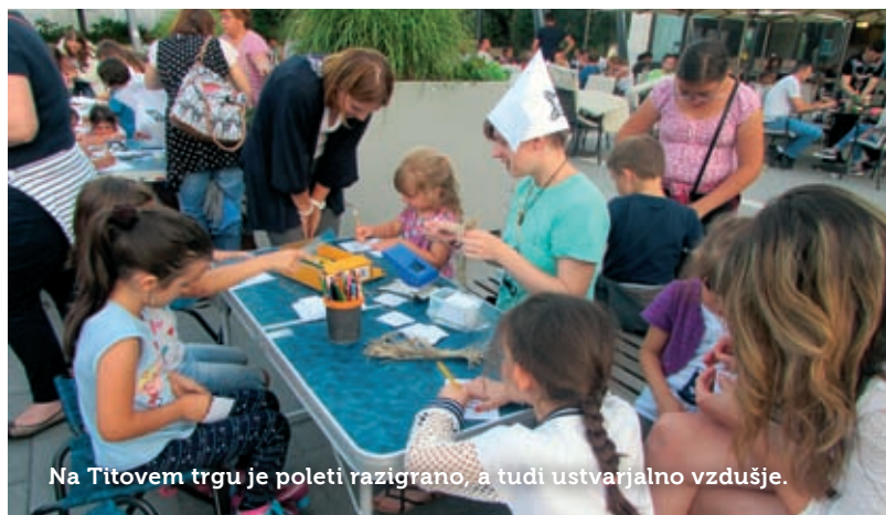
Na Titovem trgu je poleti razigrano, a tudi ustvarjalno vzdušje.