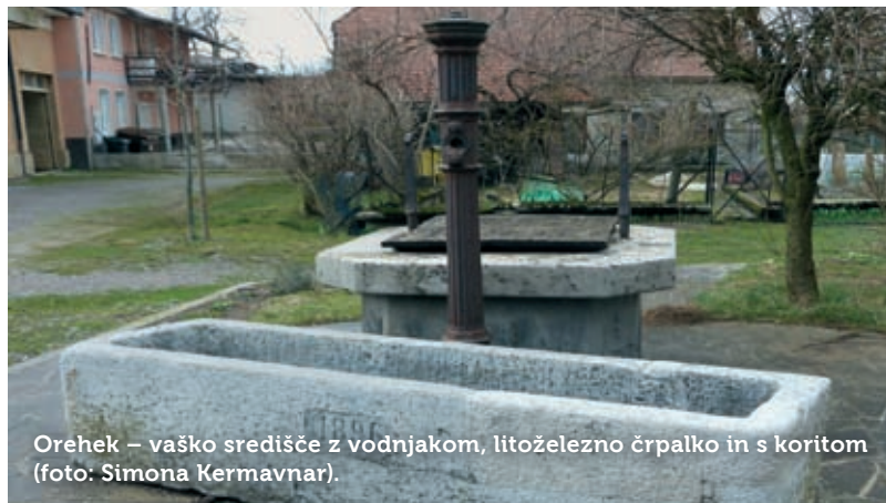
Orehek – vaško središče z vodnjakom, litoželezno črpalko in s koritom.