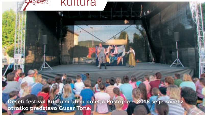
Deseti festival Kulturni utrip poletja Postojna – 2018 se je začel z otroško predstavo Gusar Tone .