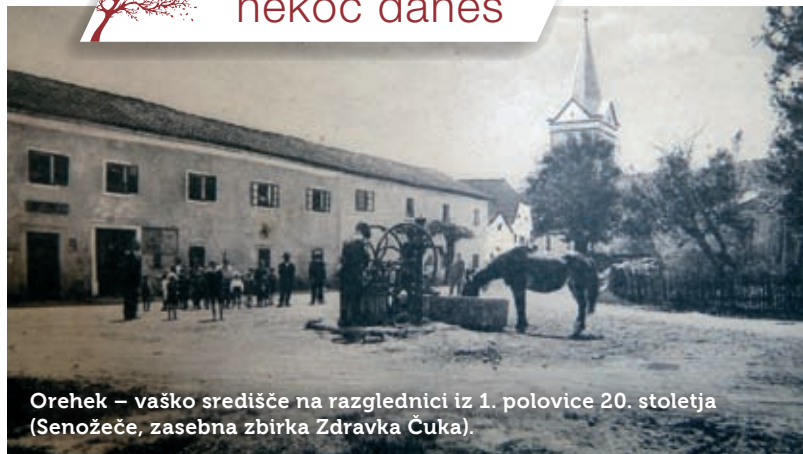
Orehek – vaško središče na razglednici iz 1. polovice 20. stoletja (Senožeče, zasebna zbirka Zdravka Čuka).