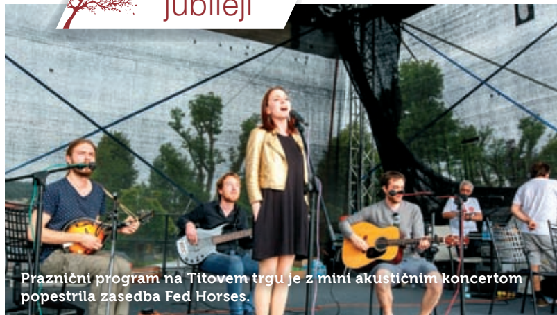
Praznični program na Titovem trgu je z mini akustičnim koncertom popestrila zasedba Fed Horses.