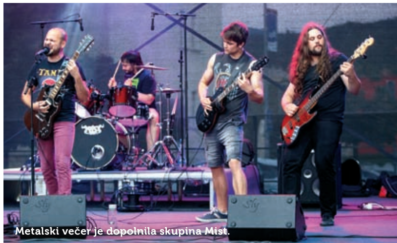
Metalski večer je dopolnila skupina Mist .