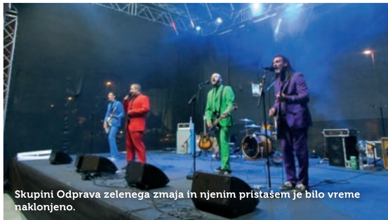
Skupini Odprava zelenega zmaja in njenim pristašem je bilo vreme naklonjeno.

Pestri bodo tudi četrčki. 12. julija so že odvrtili prvi del dokumentarnega filma Dediščina furmanstva . Napovedujejo številne koncerte; zadnji četrtek v juliju bo nastopil narodno-zabavni ansambel z mladinskimi ansambli Furmani, Strel in Amaterji . V avgustu izstopata pasji poletni dan – ko bodo celoten dan namenili človekovemu najboljšemu prijatelju z gledališko predstavo, delavnico in predstavitevjo pasem – in dalmatinski večer s klapo Kumpanji s Korčule . Slednji koncert bo v primeru slabega vremena zagotovo v postojnskem kulturnem domu. Zaključno prireditev 12. Mednarodnega košarkarskega tabora FIBA Europe so pripravili v petek, 6. julija. Obiskovalci Titovega trga so nato uživali v