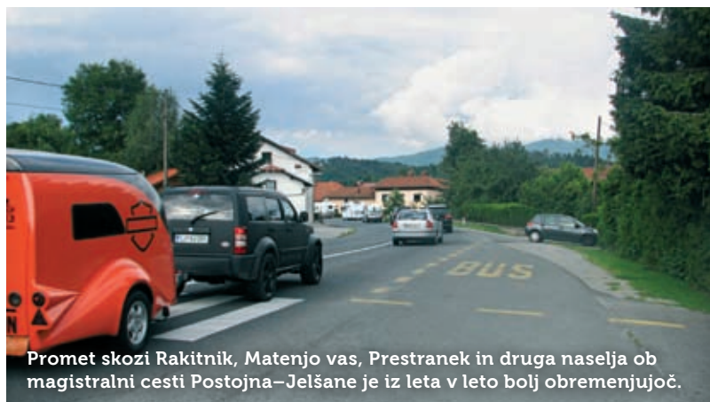
Promet skozi Rakitnik, Matenjo vas, Prestranek in druga naselja ob magistralni cesti Postojna-Jelšane je iz leta v leto bolj obremenjujoč.

Na Občini izpostavljajo še več drugih problematičnih prometnih točk, tako v samem mestu kot po drugih naseljih v občini. Za ureditev prome-