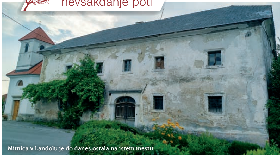
Mitnica v Landolu je do danes ostala na istem mestu.