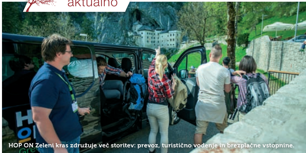
HOP ON Zeleni kras združuje več storitev: prevoz, turistično vodenje in brezplačne vstopnine.