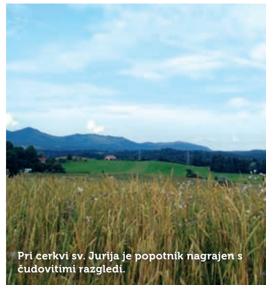
Pri cerkvi sv. Jurija je popotnik nagrajen s čudovitimi razgledi.