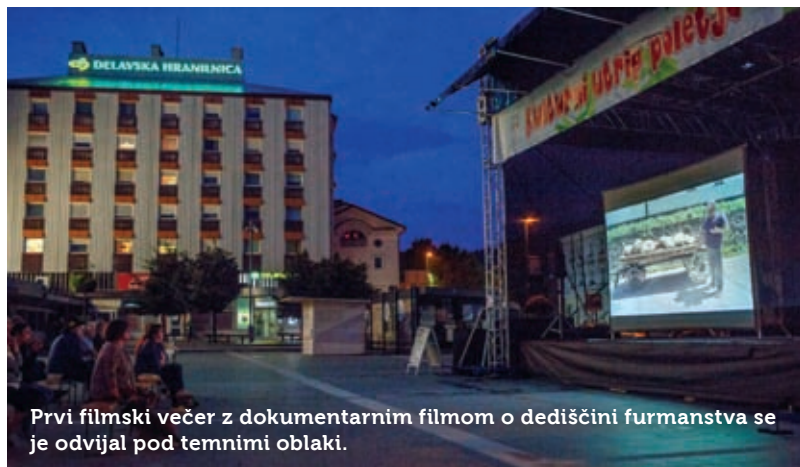
Prvi filmski večer z dokumentarnim filmom o dediščini furmanstva se je odvijal pod temnimi oblaki.