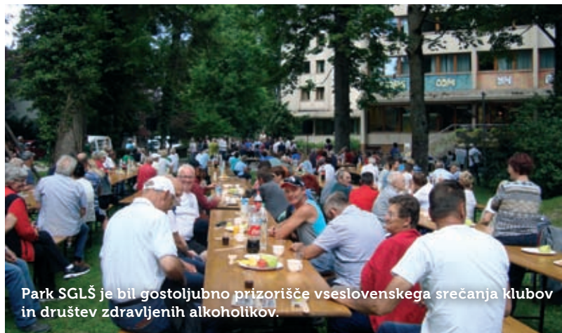
Park SGLŠ je bil gostoljubno prizorišče vseslovenskega srečanja klubov in društev zdravljenih alkoholikov.