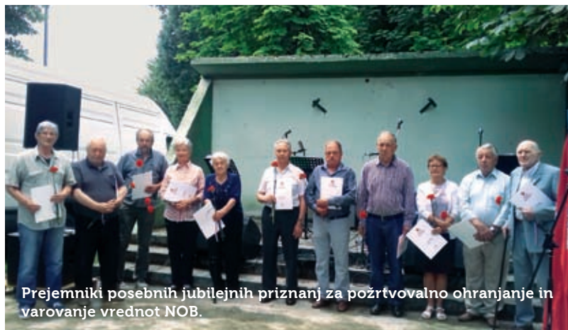
Prejemniki posebnih jubilejnih priznanj za požrtvovalno ohranjanje in varovanje vrednot NOB.