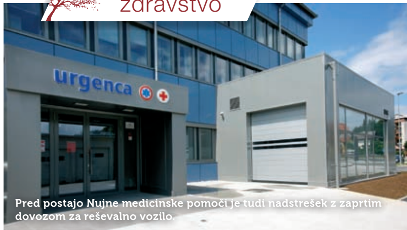
Pred postajo Nujne medicinske pomoči je tudi nadstrešek z zaprtim dovozom za reševalno vozilo.