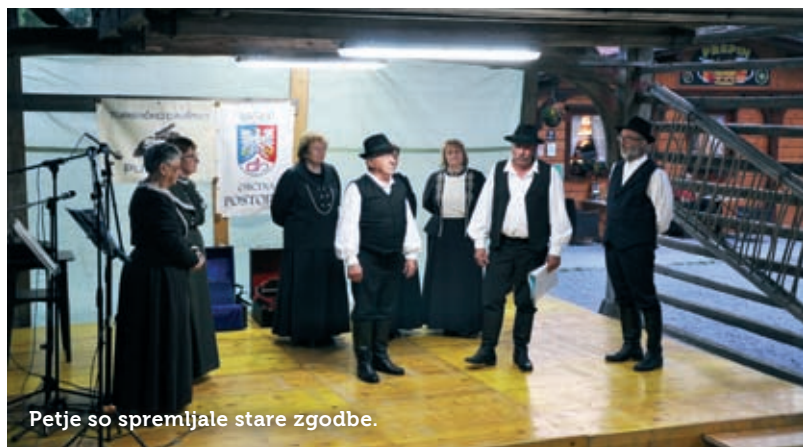
Petje so spremljale stare zgodbe.

Besedilo: Mateja Jordan; fotografiji: Valter Leban.