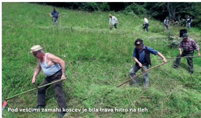
Pod večšimi zamahi koscev je bila trava hitro na tleh