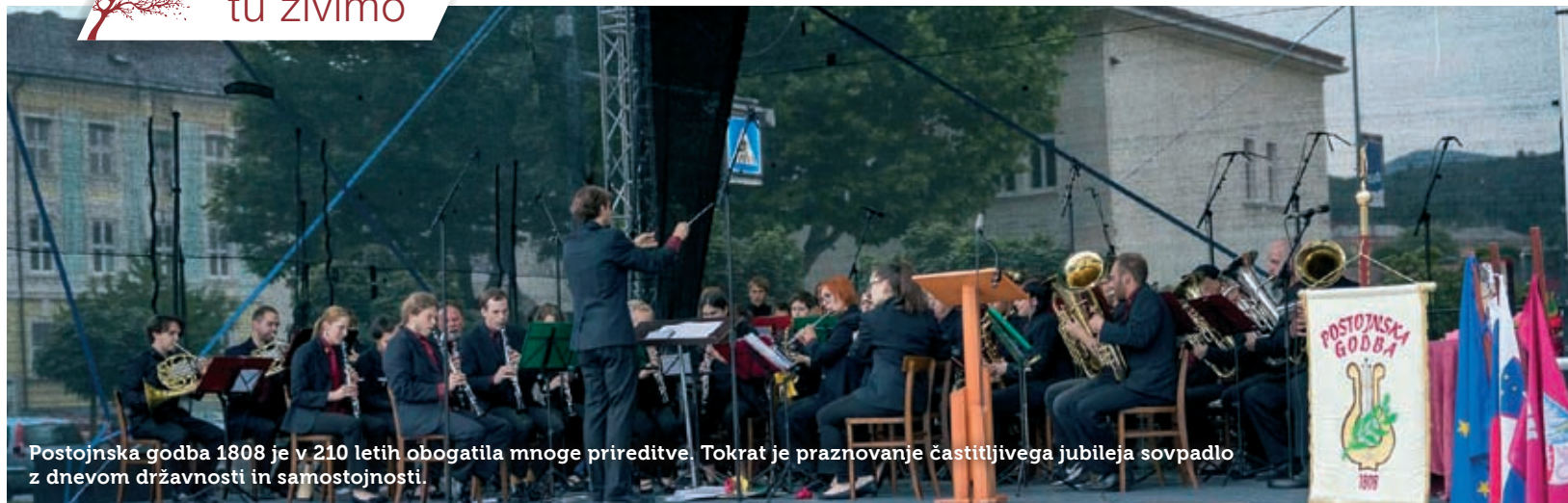
Postojnska godba 1808 je v 210 letih obogatila mnoge prireditve. Tokrat je praznovanje častitljivega jubileja sovpadlo z dnevom državnosti in samostojnosti.