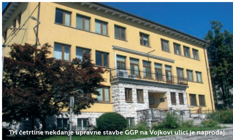
Tri četrtnine nekdanje upravne stavbe GGP na Vojkovi ulici je naprodaj.

Sicer pa je tudi GGP dobil lani novega lastnika, ljubljansko podjetje Verde – ta je v večinski avstrijski lasti. Prodaja nepremičnin pa predstavlja del sa-