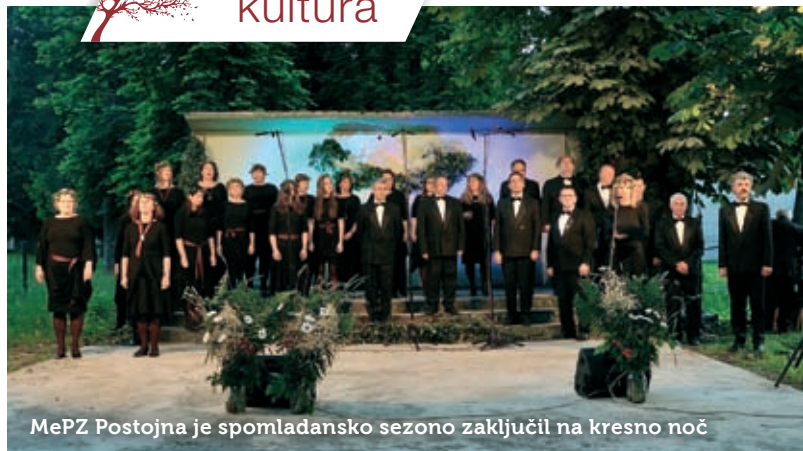
MePZ Postojna je spomladansko sezono zaključil na kresno noč