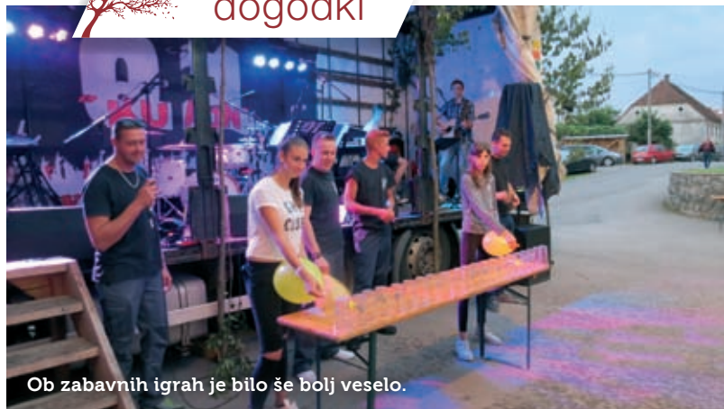
Ob zabavnih igrah je bilo še bolj veselo.