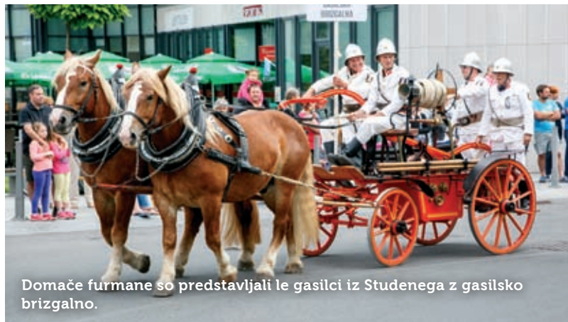
Domače furmane so predstavljali le gasilci iz Studenega z gasilsko brizgalno.

Bogato dediščino tovorniških in prevozniških dejavnosti najbolje predstavijo številni furmanski vozovi, med njimi tudi štiri- in šestvprege. Letos se jih je predstavilo deset; pripeljali so se s Krasa, z Gorenjske, Dolenjske,