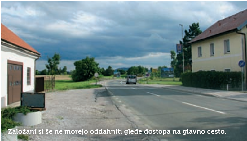
Založani si še ne morejo oddahniti glede dostopa na glavno cesto.

tno potekajo dogovori glede odkupa zemljišč. Na prednostni listi je tudi osvetlitev prehoda za pešce pri Osnovni šoli Prestranek.