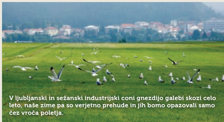
V ljubljanski in sežanski industrijski coni gnezdiijo galebi skozi celo leto, naše zime pa so verjetno prehude in jih bomo opazovali samo čez vroča poletja.

Rumenonogi galebi živijo v paru in so ptiči, dolgi dobrega pol metra, razpon peruti pa meri med 140 in 160 centimetrov. To so odlični letalci in jadralci, zato jim naše vetrovno področje zelo ustreza, zaradi daljših nog pa se radi sprehajajo, vendar so previdni in morebitne opazovalce ne spustijo bližje od dvajset metrov. Bel trup jim prekriva temno sivo in črno perje na krilih in hrbtu. Imajo oster rumen kljun, kar dobro vedo tudi nejevoljni domači kmetovalci, saj jim radi luknjajo v folijo zavite sveže bale sena. Istočasno so tudi koristne živali, saj uničijo veliko šte-