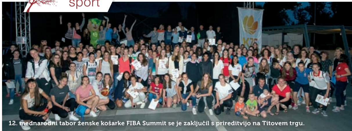
12. mednarodni tabor ženske košarke FIBA Summit se je zaključil s prireditvijo na Titovem trgu.