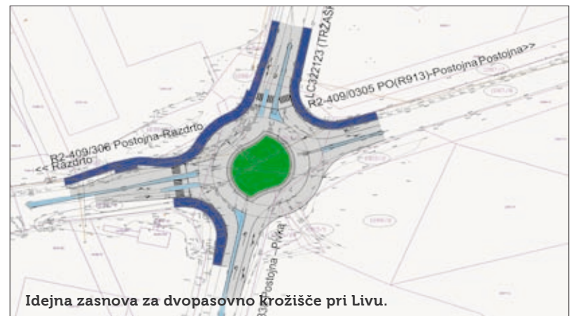
Idejna zasnova za dvopasovno krožišče pri Livu.

cestah ureditve skozi naselja dolžna financirati Občina, zato bo projekt sofinancirala. Kakšna bo ureditev, bo znano po pridobitvi projektne dokumentacije. Z njo se določi obseg del in posledično tudi vrednost projekta. »Glede na navedeno ocenjujemo, da bi bil razpis za gradnjo objavljen v drugi polovici leta 2019,« še predvidevajo na DRSI.