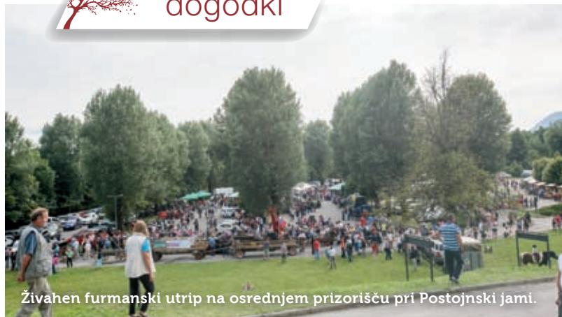
Živahen furmanski utrip na osrednjem prizorišču pri Postojnski jami.